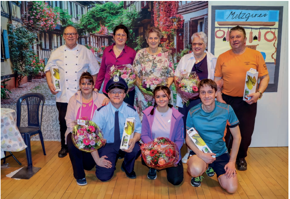
Die Theatergruppe des Musikvereins Berg zeigte sich im Dreiakter «Jetzt chunnts nöd guet» von ihrer sportlichen und humorvollen Seite.

Natürlich durften auch die grosse Tombola und die Festwirtschaft nicht fehlen. Nach dem Theater spielte das Bergland-Trio aus Flawil auf, und es wurde kräftig das Tanz-