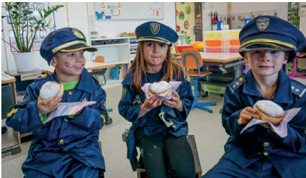
Bild oben: Bunte Luftschlangen und der verlockende Duft frisch gebackener Berliner...

Bilder links oben und links: Das ausgelassene Feiern machte hungrig, und so liessen sich zum Abschluss alle die süssen Berliner schmecken.