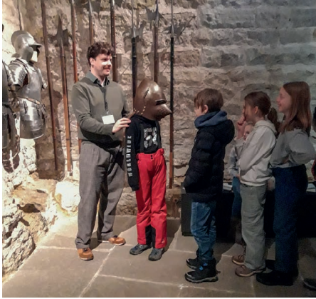
Wir durften auch noch einen Ritterhelm anprobieren.