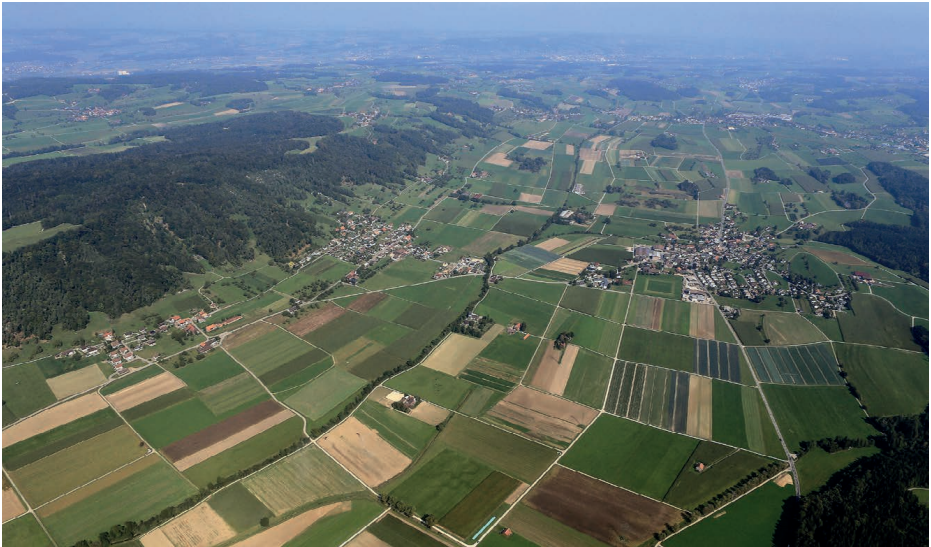
Blick auf das Lauchetal in Richtung Osten. Von links: Kalthäusern, Weingarten, Lommis

Die Bevölkerungsentwicklung der Gemeinde Lommis zeigt eine stabile und positive Entwicklung. Zum Stichtag 31. Dezember 2024 zählte die Gemeinde insgesamt 1'316 Einwohnerinnen und Einwohner. Die Verteilung auf die Ortschaften ist wie folgt: In Lommis leben 864 Personen, während die Dorfteile Weingarten und Kalthäusern 452 Personen beheimatet.