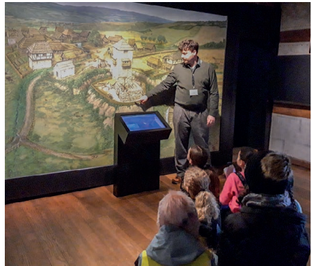
In einem Raum war eine Karte, die das frühere Frauenfeld darstellte.

Dann zeigte er uns noch den Rest des Schlosses. Wir gingen als nächstes in einen Raum mit einer Karte an der Wand, die das