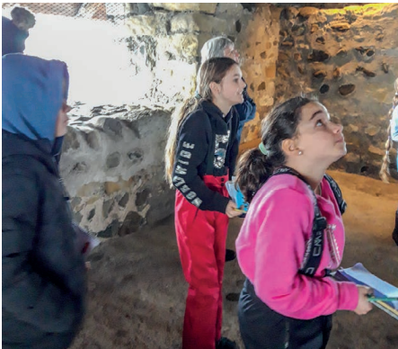
Der Bergfried ist 19 Meter hoch und die Mauern sind 3 Meter dick.

Zuerst zeigte er uns den Bergfried. Der Bergfried ist 19 Meter hoch und die Mauern sind 3 Meter dick. Er wurde aus Findlingen gebaut, die bis zu einer Tonne schwer sind.