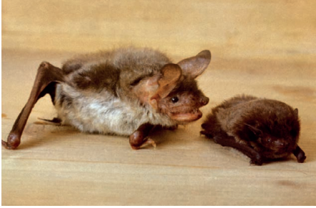
Grosses Mausohr und Zwergfledermaus

Das Schaffen von Natur-Inseln und «Öko-Ecken» lohnt sich überall. Je dichter das Angebot ist, desto grösser die Wirkung. Jeder Quadratmeter mit blühenden einheimischen Blumen und Sträuchern ist wertvoll! Gerade in unseren Gärten und auf unseren Balkonen können wir dies mit wenig Aufwand tun.