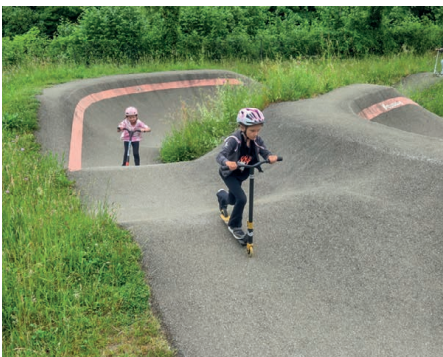
Besuch eines Pumptracks

Neben den sportlichen Aktivitäten kam auch der kreative Bereich nicht zu kurz. Mit viel Fantasie wurden aus alten Veloschläuchen kreative Arbeiten gestaltet.