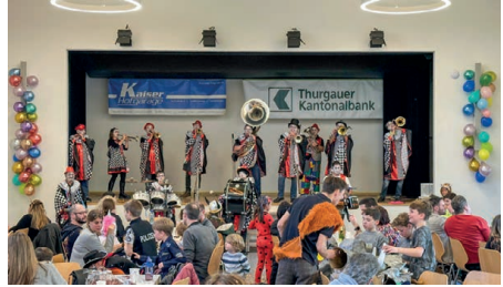
Kindermaskenball mit Guggenmusik Rivels

Ende Januar fuhren wir für unser Skiweekend nach Flims. Nach anfänglichen Problemen, den korrekten Parkplatz beim Hotel zu finden, konnten wir dann am Samstag die Sonne auf der Piste geniessen. Auf-