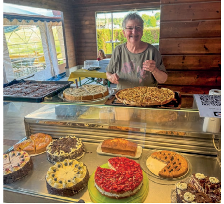
«Wer die Wahl hat, hat die Qual!» Grosse Auswahl an Kuchen und Torten.

Dorfverein auf seine Kosten mit einer grossen Auswahl an Torten und Kuchen. Es war ein rundum gelungenes Fest, das einmal mehr gezeigt hat, wie lebendig und harmonisch das Dorfleben sein kann. Ein herzliches Dankeschön an alle Helfer,