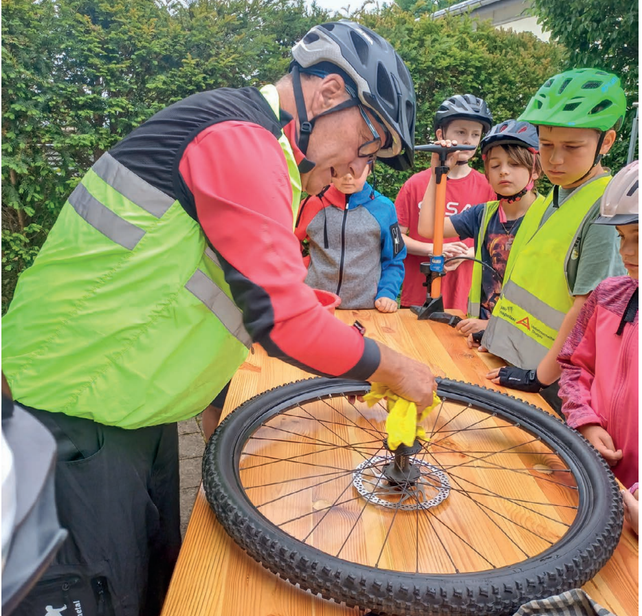
Die Kinder konnten praktische Erfahrungen sammeln; beispielsweise bei der Pflege des Velos.

Zudem bastelten die Kinder farbenfrohe Wimpel und Laufenten. Eine Kutschfahrt sorgte dabei für zusätzliche Abwechslung.