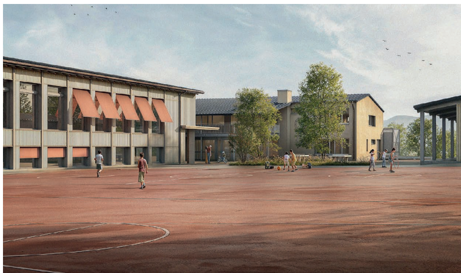
Visualisierung des neuen Schulhauses westlich des bestehenden Allwetterplatzes

Schulbehörde und Planungskommission der Primarschule Lommis