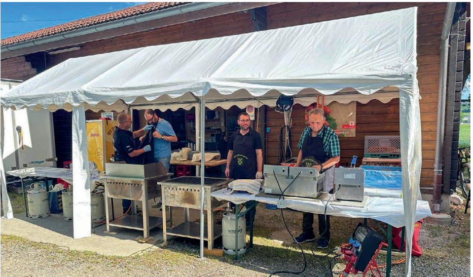
Der Duft von verschiene Köstlichkeiten vom Grill lockte die hungrigen Gäste an.