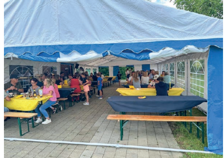
Gemütliches Beisammensein am Dorffest

Ab 17:00 Uhr startete das offizielle Rahmenprogramm für Gross und Klein. Während sich die kleinsten Festbesucher auf der Hüpfburg austobten oder im grossen Sandkasten fleissig Burgen bauten,