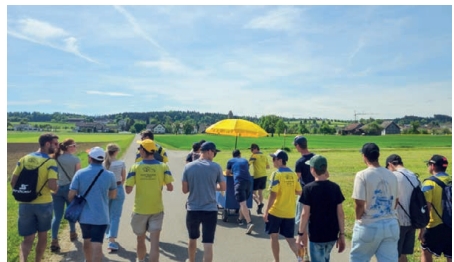
Maibummel zur neu gepflanzten Eiche