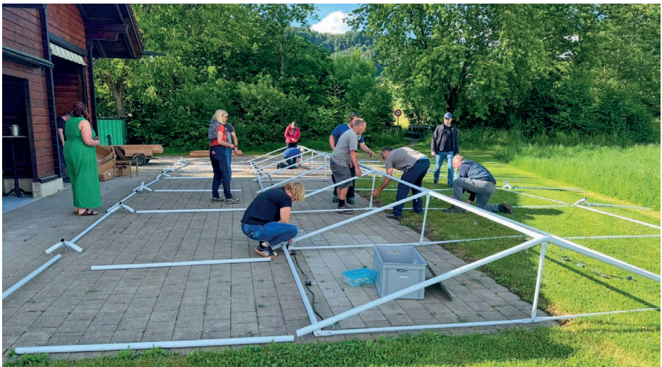
Fleissige Helferinnen und Helfer bauten das neue Festzelt auf.

Der Duft von verschiedenen Köstlichkeiten vom Grill lockte die hungrigen Gäste an und wer es lieber süss mochte, kam dank zahlreichen Kuchenbäckerinnen aus dem