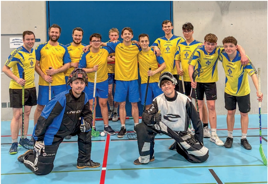
Unihockey-Plauschturnier in Bazenheid

grund des mangelnden Schnees waren die geöffneten Pisten gut gefüllt und unsere Turner wurden am Skilift in Geduld geübt. Am Sonntag wurden die Pisten bis