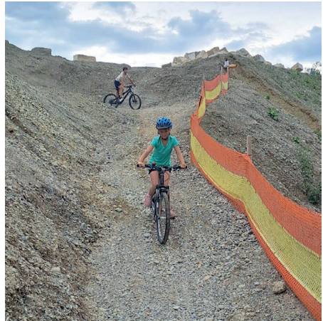
Abfahrt in die Hölle

Die Biker vom Lauchetal schlagen wieder zu und verwandeln die Kiesgrube Tobel auch diesen Sommer in ein Bike-Paradies. Und dieses Jahr hat es die Location in sich: Die Kiehügel sind gefühlt dreimal so hoch, die Gruben tiefer als je zuvor. Ein Albtraum für die Parcoursbauer, aber der absolute Jackpot für euch! Egal ob du über die Hindernisse fliegen oder einfach gemütlich deine Runden drehen willst: Dank cleveren Umfahrungen kommt hier jeder auf seine Kosten, ganz ohne Rennstress. Für die Mini-Biker (und die stolzen Eltern) gibt es natürlich wieder eine eigene Family-Zone.