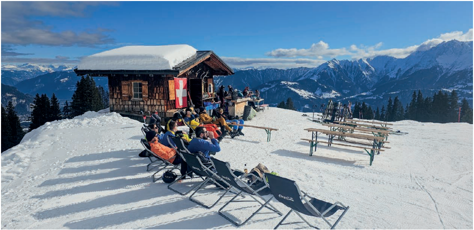
Skiweekend in Flims

zum Schluss genossen. Ein grosses Dankeschön an unsere Organisatoren Laurin Ihle und Ilja König, es war ein gelungenes Wochenende.