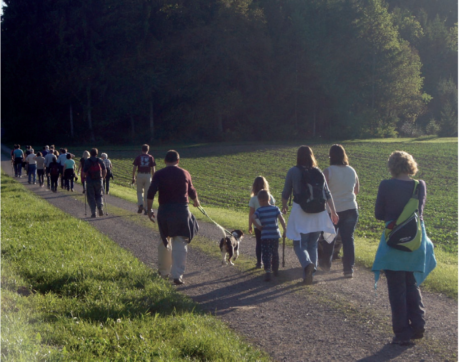
Der diesjährige Abendspaziergang führt am 15. Juni zum Schloss Sonnenberg.

möchten wir nicht missen und laden Sie schon heute ein, zur diesjährigen Abendwanderung.