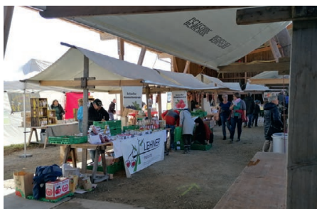
Es findet wieder ein Bauernmarkt statt.