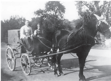
Historische Aufnahme: Pferdewagen klein

Geplant war der historische Spaziergang durch Lommis im vergangenen Oktober. Aus verständlichen Gründen wurde dieser verschoben. Inzwischen hat sich die Situation beruhigt. Aktuell dürfen sich Gruppen mit entsprechenden Abständen wieder treffen. Wie versprochen werden