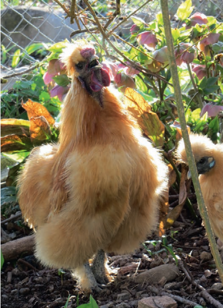
Frau Henne gackerte laut zur Begrüßung.

Zum Abschluss besuchte die Klasse dann bei herrlichem Sonnenschein den Hühnerhof, wo uns der Hahn aus nächster Nähe zeigte, wie gut er krähen kann. Wo uns die Hühner erlaubten, ihre versteckten Eier zu sehen und die flauschigen