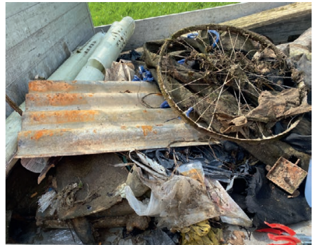
Viel Abfall wurde eingesammelt.

Einen kalten und mühsamen Job haben die Fischer gemacht, in dem sie mit grossen und kleinen Helfern einen Abschnitt der Lauche und das Bachbort von Stettfurt her bis zur Mühle gereinigt haben. Erstaunlich, ja bedenklich, was da alles aus dem Bach gezogen wurde. Zum Abschluss hat eine kleine Equipe noch Abfall gesammelt an der Banneggstrasse entlang im Wald nach St. Margarethen. Auf diesem kurzen Waldstück wurde dieses Frühjahr nun zum drittenmal Abfall eingesammelt. Auch diesmal wurden wieder eine grosse Anzahl Aludosen, Petflaschen, Plastiksäcke, usw. eingesammelt. Unglaublich, was auf dieser