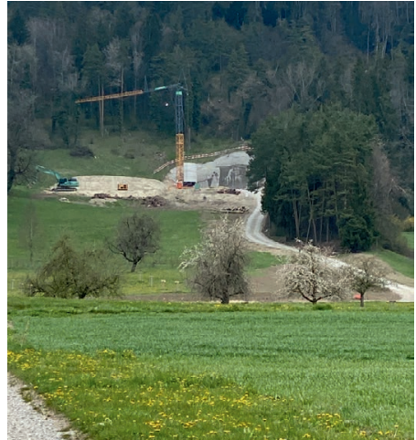
Zufahrt und Baustelle sind von weither sichtbar.