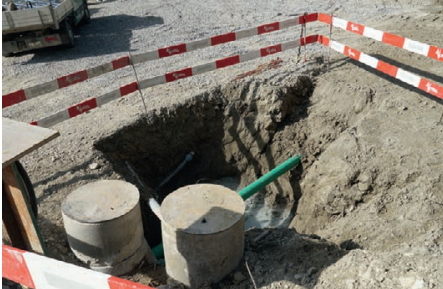
Sammelschächte für Schmutzwasser und Sickerwasser

Inzwischen sind die Aushubarbeiten abgeschlossen. Als nächster Schritt folgte der Einbau des Magerbetons. Für die Baumeisterarbeiten wurde Mitte April ein Kran gestellt.