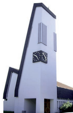
Evangelische Kirchgemeinde Lommis