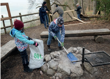
Grosse Anzahl Helfer und viele Kinder ...