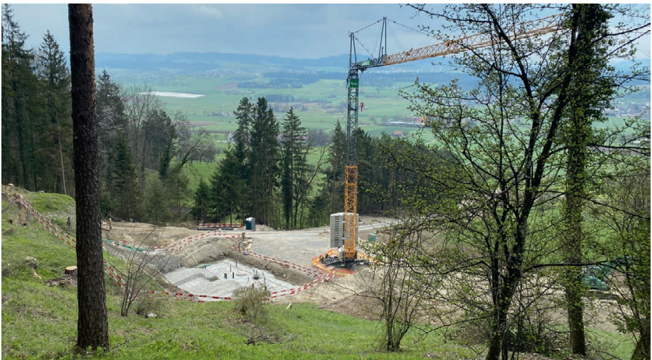
Der Kran steht. Tolle Aussicht von der Baustelle.

zogen. Die Belastplatten wurden dann zur Stabilisierung des Krans verwendet.