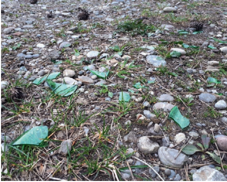
In diesem Frühjahr gab es viel aufzuräumen.