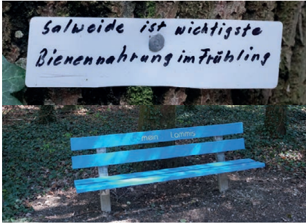
Die Ruhebänk ist repariert.

Die zerstörte Bank im Bannegwald ist nun fest eingemauert und die zerbrochenen Sitzbretter sind ersetzt. Bei der Ausführung der Arbeiten ist uns am Baum hinter der Bank eine interessante Notiz auf einem Zettel aufgefallen, mit dem