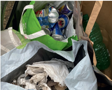
Sackweise Abfall von der Banneggstrasse