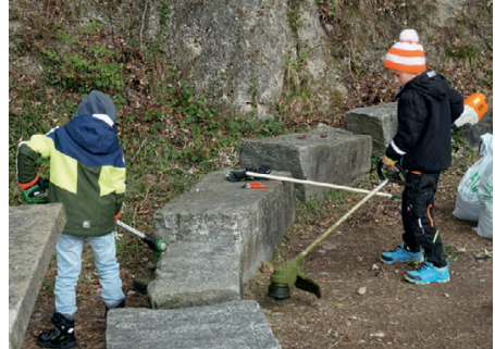
... sind dem Aufruf zum «Uufrumtag» gefolgt.

Wir haben wunderschöne und ganz besondere Grillplätze, die viel genutzt werden und die wir unseren Gästen auch gerne zeigen. Die Plätze sind beliebt, nicht nur in diesen Zeiten, wo wir weniger reisen und vermehrt zu Hause sind.