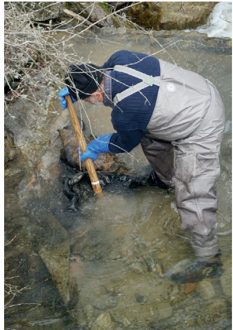
Die Fischer reinigten, zusammen mit Helfern, einen Abschnitt der Lauche und das Bachbord von Stettfurt her bis zur Mühle.

Eine grosse Anzahl Helfer und viele Kinder sind Mitte April dem Aufruf zum jährlichen Uufrumtag gefolgt. Aus bekannten Gründen haben wir im vergangenen Jahr den beliebten Anlass nicht durchgeführt. Entsprechend viel gab es dieses Frühjahr aufzuräumen, zu flicken und einzurichten. Holz auffüllen, beschädigte Bänke flicken und teilweise ersetzen. Feuerstellen ausräumen, Schnitzel verteilen und den Zaun flicken. Der Forstwart musste sogar einige Bäume am Kaabach fällen, weil Baumgipfel und Äste gebrochen waren und somit die Gefahr bestand, dass diese auf den Grillplatz runterfallen konnten. Auf der oberen Tili wurden zwei zusätzliche Absperrungen gestellt.