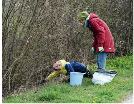
Klein und Gross machten eifrig mit.