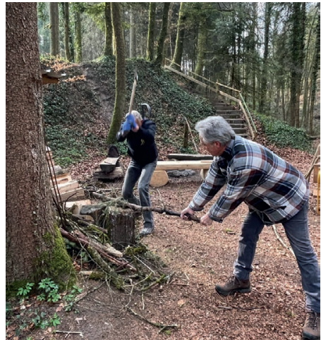
Holzacker an der Feuerstelle Kaabach

Einen kalten und mühsamen Job haben die Fischer gemacht, in dem sie mit grossen und kleinen Helfern einen Abschnitt der Lauche und das Bachbort von Stettfurt her bis zur Mühle gereinigt haben. Erstaunlich, ja bedenklich, was da alles aus dem Bach gezogen wurde. Zum Abschluss hat eine kleine Equipe noch Abfall gesammelt an der Banneggstrasse entlang im Wald nach St. Margarethen. Auf diesem kurzen Waldstück wurde dieses Frühjahr nun zum drittenmal Abfall eingesammelt. Auch diesmal wurden wieder eine grosse Anzahl Aludosen, Petflaschen, Plastiksäcke, usw. eingesammelt. Unglaublich, was auf dieser