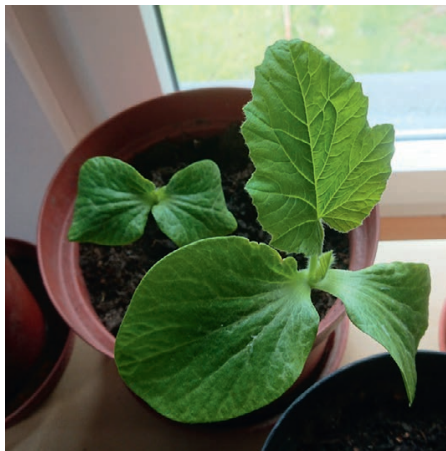
Samen für Risenkürbisse erhalten Sie von uns. www.tv-lommis.ch

E-Mail ( kuerbisfest@tvlommis.ch ) oder melden Sie sich ganz bequem auf unserer Homepage an ( www.tvlommis.ch ).